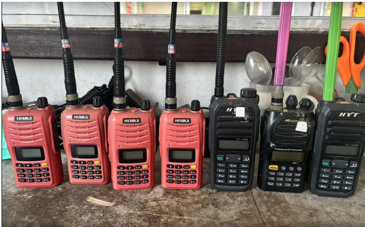
การดูแลรักษา HYT TC-๕๘๐/MS marshall MS-๑/ HIMAX X-๕